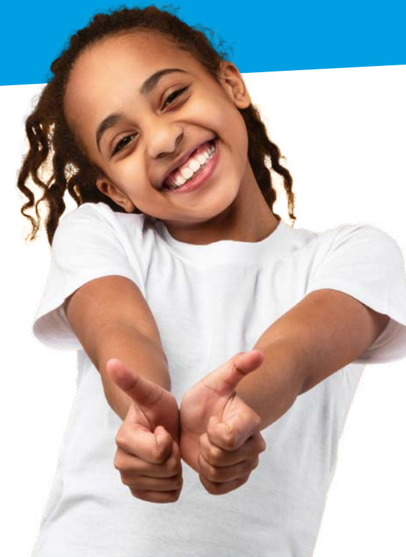
Inks: © iStock.com/Prostock-Studio | Titel: © iStock.com/djedzura